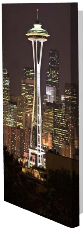
Pohled zepředu (zobrazený s volitelným Image Wrap™)